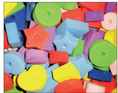
viel mehr Helligkeit